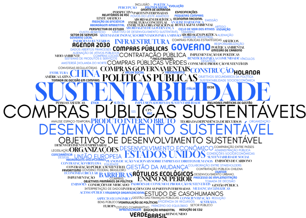
Imagem 1: Nuvem de Palavras Chave

"contratações públicas sustentáveis", utilizada na questão de pesquisa desta revisão, sugere uma preferência terminológica ou uma maior incidência nos estudos analisados.