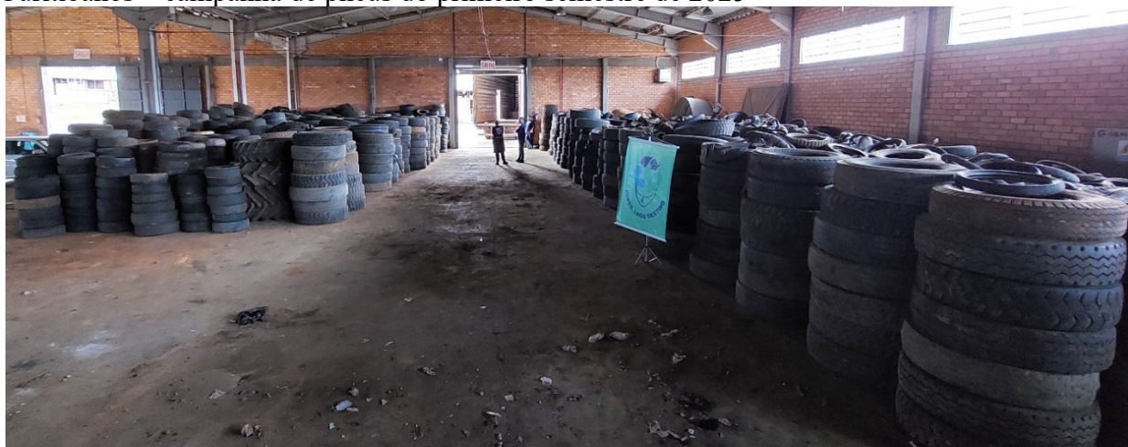
Figura 10. Pneus armazenados no Ponto de Consolidação Regional (PCR) temporário de Curitibaanos – campanha de pneus do primeiro semestre de 2025