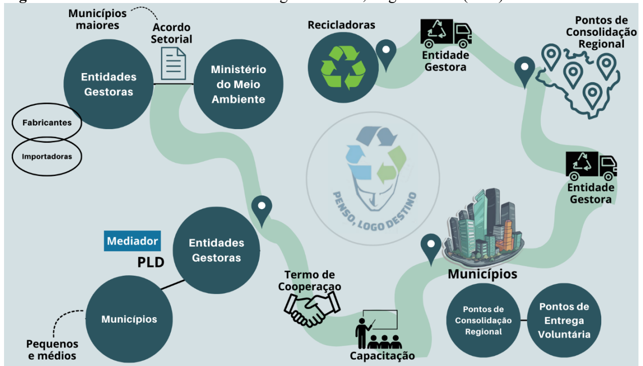
Figura 2. Forma de funcionamento do Programa Penso, Logo Destino (PLD)