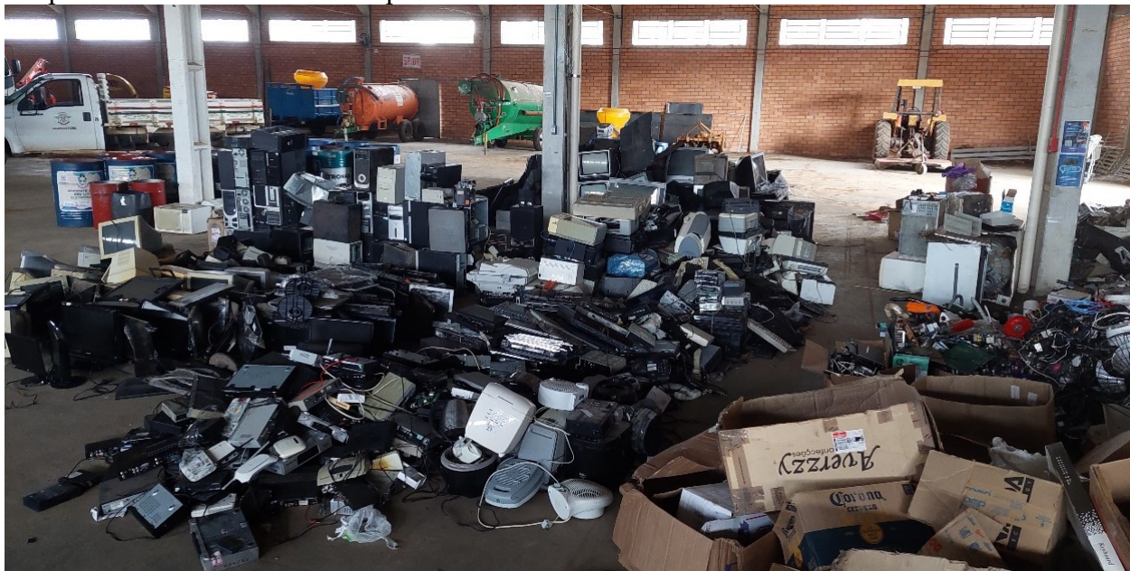
Figura 6. Resíduos da logística reversa armazenados no Ponto de Consolidação Regional (PCR) temporário de Curitibaanos – campanha de novembro de 2024