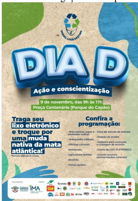
Figuras 7. Modelo de material visual de divulgação da campanha do município de Curitibaanos