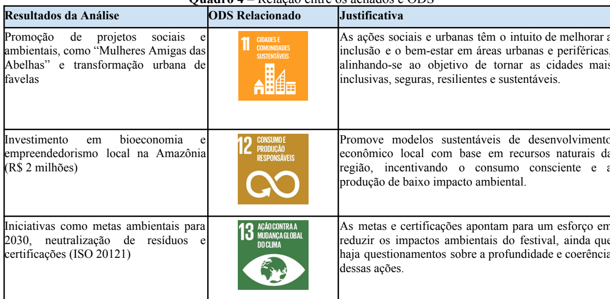
Quadro 4 – Relação entre os achados e ODS

Paralelamente, observa-se uma dissonância entre as práticas e o discurso do próprio evento "Amazônia Para Sempre", onde uma superprodução em um ambiente sensível pode contradizer a mensagem de preservação. Contudo, alinhando esse discurso e análise as ODS 11, 12 e 13 tem-se o seguinte resultado: