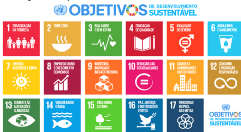
Figura 1 – Objetivos de Desenvolvimento Sustentável

Paz e Kipper (2016) apontam que esses benefícios sustentáveis se desdobram em três dimensões: econômica (redução de custos e aumento de eficiência), social (melhoria das relações com a comunidade e os colaboradores) e ambiental (uso consciente de matérias-primas). Esses pilares estão alinhados à Agenda 2030 da ONU e seus 17 Objetivos de Desenvolvimento Sustentável (ODS), lançados em 2015 para guiar ações globais rumo à sustentabilidade.