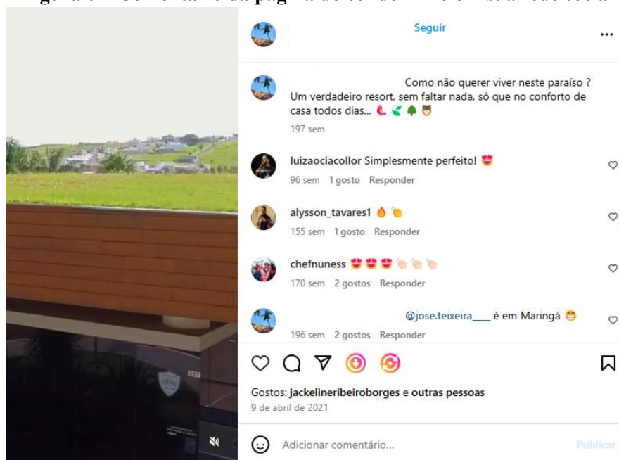
Figura 6 – Comentário da página do condomínio em sua rede social