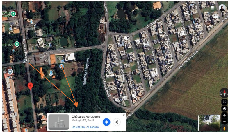
Figura 1 – Localização da entrada do condomínio