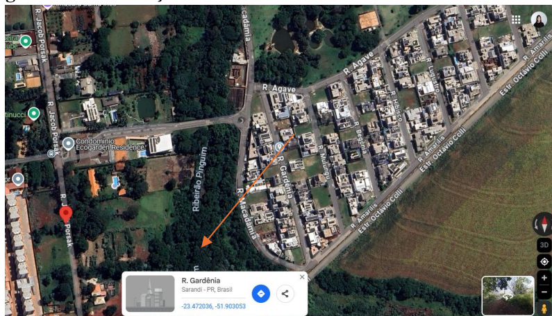
Figura 2 – Localização das residências de moradores do condomínio