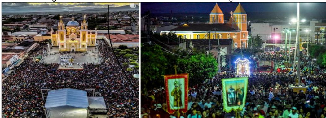
Figura 2: Romarias e a Festa de São Francisco das Chagas na atualidade