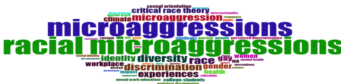
Figura 1: nuvem de palavras gerada a partir dos títulos e resumos dos artigos

Análises complementares indicam que os termos mais recorrentes nos títulos e resumos dos artigos sobre o tema incluem “racial microaggressions”, “diversity”, “discrimination”, “identity”, “critical racial theory” e “workplace”, conforme ilustra a Figura 2. Essa concentração semântica reforça o vínculo entre microagressões raciais e o contexto organizacional, especialmente na forma de discriminação sutil, insatisfação no trabalho e impactos à saúde mental.