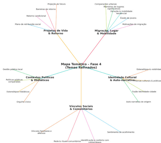
Figura 2: Mapa temático em desenvolvimento.

“Motivações de migração” para “Migração e Mobilidade” (Figura 2). Essa revisão garantiu que os temas representassem de forma precisa e fidedigna os padrões de significado nas narrativas (BRAUN; CLARKE, 2021).