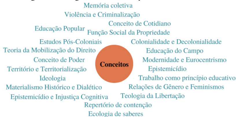
Figura 1 - Categorias conceituais presentes na literatura.

Os estudos analisados fazem uso de uma diversidade de conceitos teóricos oriundos de distintas áreas do conhecimento, os quais são empregados para examinar diferentes aspectos dos movimentos sociais, dos conflitos agrários e da construção do conhecimento. A Figura 1 ilustra as principais categorias conceituais identificadas nos artigos revisados.