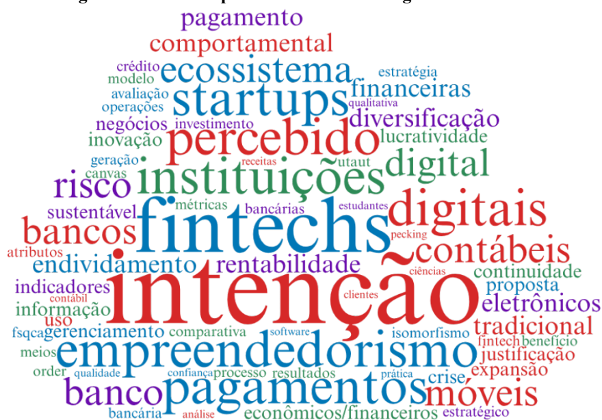
Figura 5. Nuvem de palavras-chave dos artigos analisados

Complementarmente, a Figura 5 apresenta uma nuvem de palavras-chave, elaborada a partir da frequência dos termos nos títulos, resumos e palavras-chave dos artigos. Observa-se o destaque para termos como “fintech”, “intenção”, “usuário”, “regulamentação” e “instituições”, revelando os principais eixos de atenção da produção nacional.