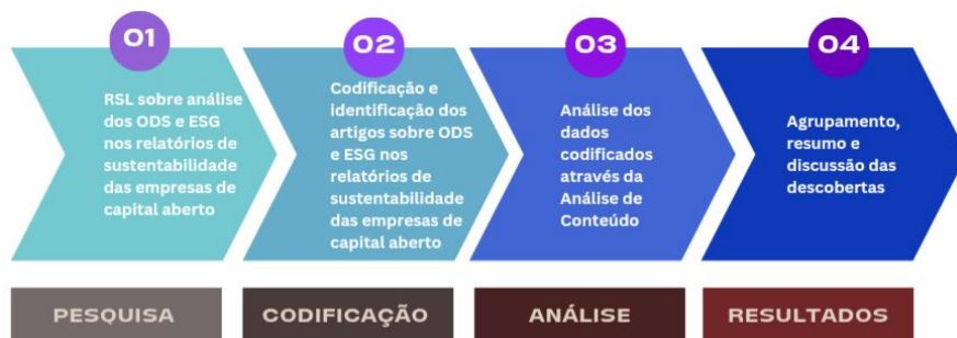
Figura 1. Abordagem do Método