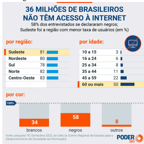
Figura 2 - Acesso à internet no Brasil