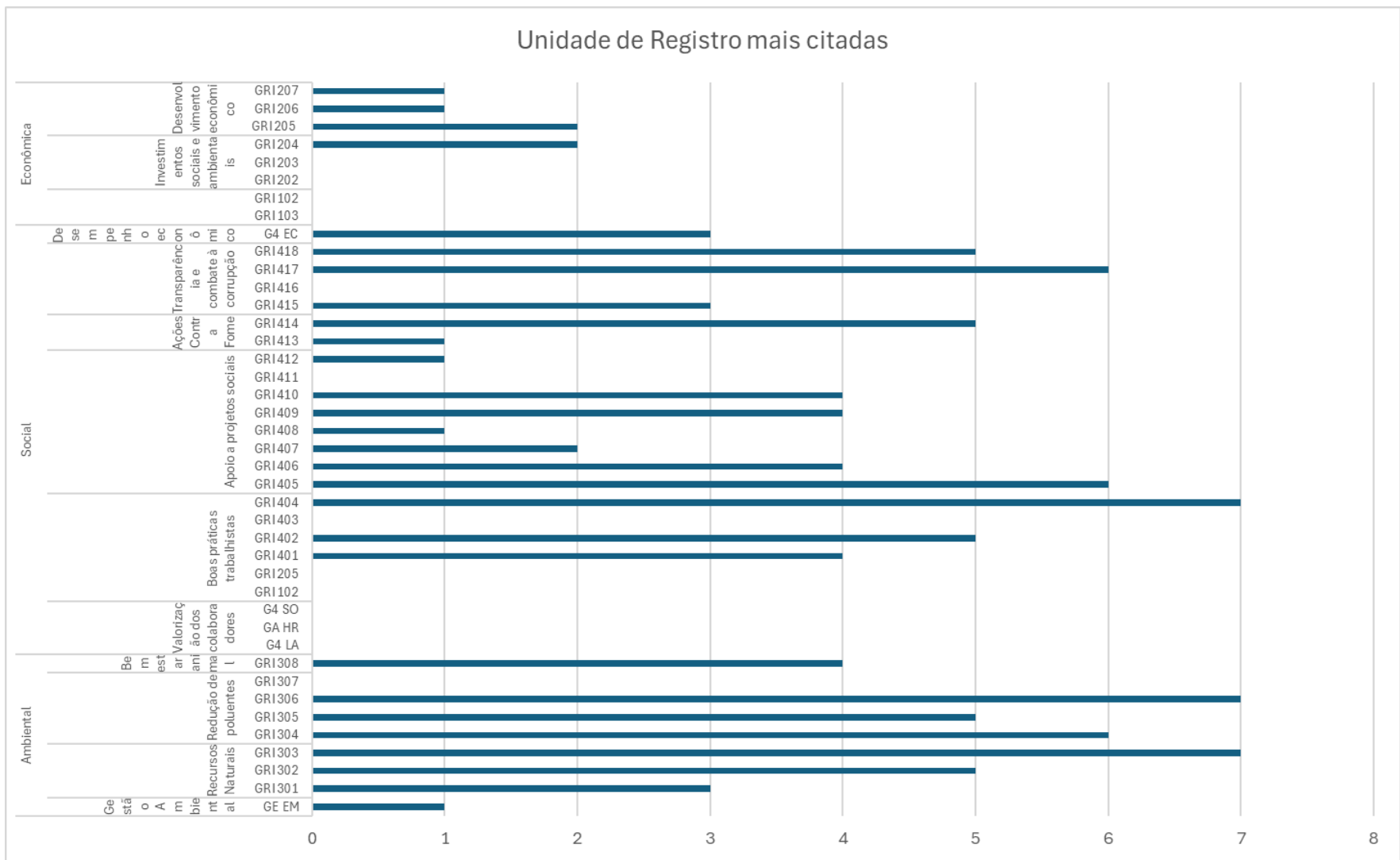
Gráfico 2- Unidade de registro mais citadas