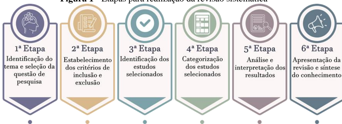
Figura 1 - Etapas para realização da revisão sistemática

Fonte: Adaptado de Botelho, Cunha e Macedo (2011)