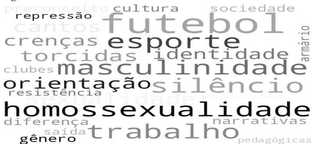
Figura 1 - Palavras mais recorrentes

Por outro lado, foram desconsiderados os artigos duplicados, não disponíveis na íntegra e que não tenham como foco principal a discussão dos construtos selecionados. Após a definição desses critérios, foi realizada a leitura dos resumos e palavras-chave no intuito de verificar a aderência dos textos pré-selecionados, conforme a terceira etapa do modelo. Uma vez finalizado esse processo, foi possível obter 12 artigos selecionados que conformaram o corpus textual da revisão. Na quarta etapa, foi feita a leitura na íntegra dos textos selecionados, selecionando pontos de interseção e divergência a fim de estabelecer categorias analíticas. Para auxiliar nesse processo de categorização, também foi realizada uma análise dos léxicos mais recorrentes ao longo da coletânea, com auxílio da ferramenta visual da nuvem de palavras.