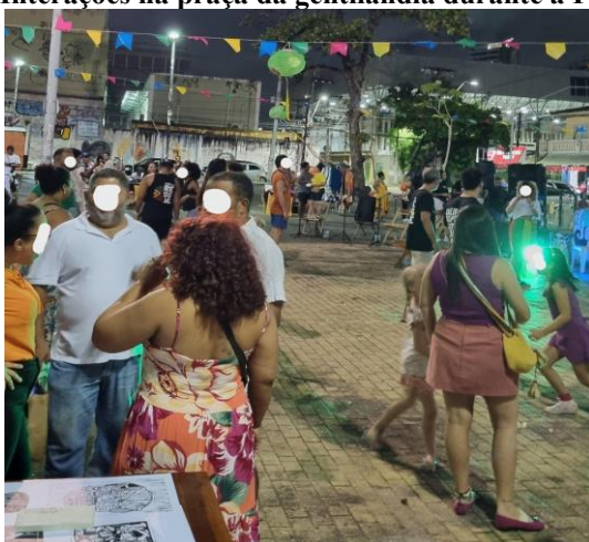
Figura 2: Interações na praça da gentilândia durante a Feira Negra