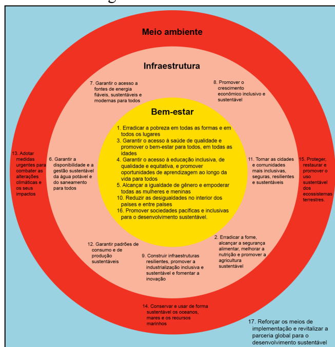
Figura 1 - “Framework for examining interactions between Sustainable Development Goals”