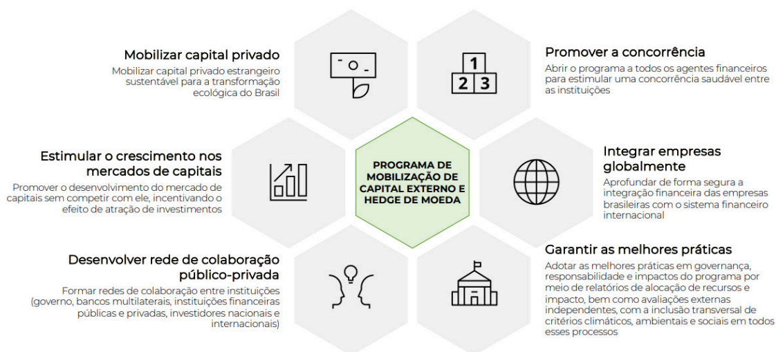
Figura 1: Princípios Fundamentais do Programa de Mobilização de Capital Externo e Proteção Cambial