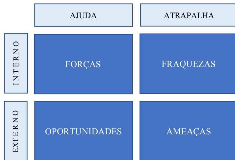
Figura 4. Modelo de Matriz SWOT

Para essa discussão, sugerem-se os autores: Kotler e Keller (2016); Kotler et al. (2016) e Bley (2022). Ao identificar os pontos de cada bloco de análise, o docente deve solicitar a construção da matriz, conforme modelo apresentado na Figura 4.