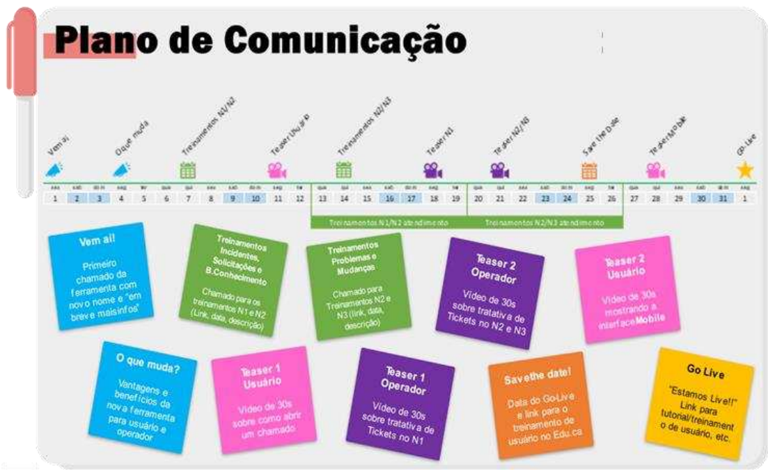
Figura 2 - Plano de comunicação da nova ferramenta de ITSM.

Durante todo o projeto, as áreas operacionais, táticas e executivas eram comunicadas sobre o projeto e escaladas, quando necessário, para viabilização das atividades do projeto.