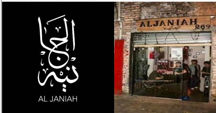
Figura1. Restaurante Al Janiah

Estabelecimento A: Restaurante Al Janiah