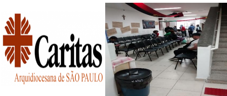
Figura 3. Caritas Arquidiocesana de São Paulo