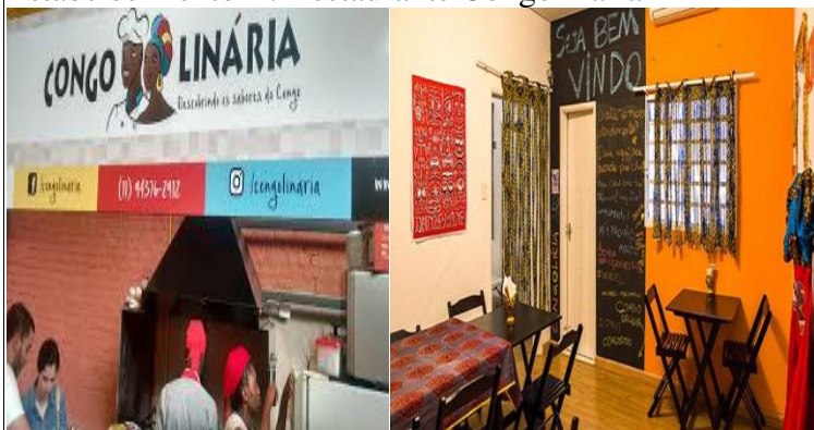
Figura 2. Restaurante Congolinária