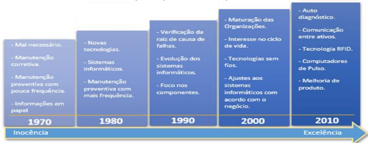
Figura 2 - Evolução do SGA

A gestão de ativos é a evolução natural da operação e monitorização dos ativos pertencentes às organizações, visando a otimização de seus desempenhos, surgindo assim uma resposta aos novos requisitos da indústria, com o aumento da necessidade da disponibilidade e confiabilidade e das garantias de qualidade no fornecimento de serviços e produtos. A figura 2 representa a evolução da gestão de ativos no período de meio século, desde meados 1970 até 2010, relacionando-a com a evolução do pensamento corporativo.