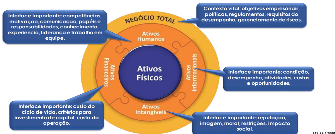
Figura 1- Abrangência do SGA

Os ativos físicos representam apenas uma das cinco dimensões dos tipos de ativos que têm de ser geridos de forma holística, a fim de atingir o plano estratégico organizacional. Ativos humanos são entendidos como a motivação, a experiência, responsabilidades e as competências de seus recursos humanos. Já os ativos informacionais correspondem a dados e informações das mais variadas atividades e de todas as partes interessadas que promovam a melhoria contínua do desempenho organizacional. Em sequência, os ativos financeiros englobam os custos totais do ciclo de vida, critério de investimento de capital e custo de operação. Os ativos intangíveis contemplam a propriedade intelectual, a reputação, a moral, a imagem da organização.