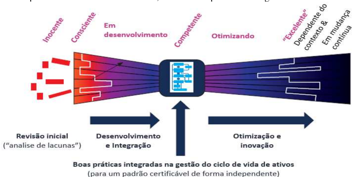
Figura 3- Níveis de maturidade do SGA.

Nota-se a introdução do conceito de maturidade em gestão de ativos. A constante evolução cria para o gestor do sistema de gestão de ativos variadas implicações, pois sua função está constantemente mudando para atender as necessidades e expectativas das partes interessadas, isto significa que os gestores têm de compreender e aplicar novas práticas, e tecnologias para melhorar as suas operações, bem como tratar adequadamente um aparente paradoxo, que é construir sistemas de gestão robustos de forma que seu desempenho independa das pessoas inseridas no mesmo, mas concomitantemente deve desenvolver equipes de alto desempenho, que inseridas nos processos robustos produzam resultados cada vez melhores e de maneira sustentável. O IAM divulgou uma nova escala de maturidade para a gestão de ativos, contemplando seis níveis de maturidade, conforme explicitado na figura 3: