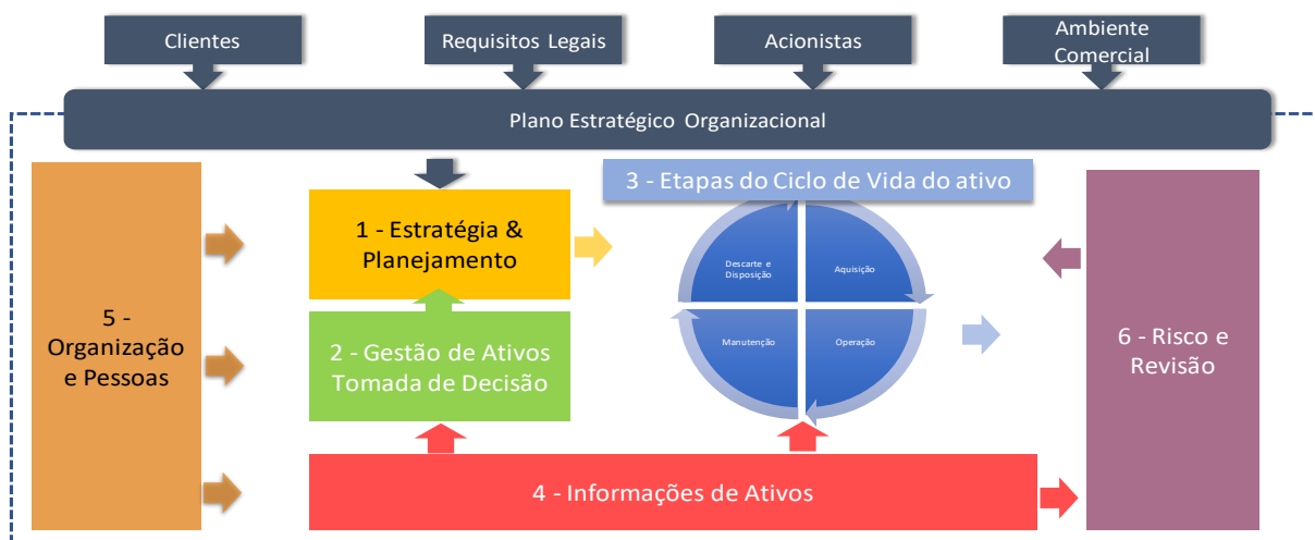
Figura 4- Modelo Conceitual do SGA.

O modelo conceitual do SGA preconizado pelo IAM se explicita na figura 4.