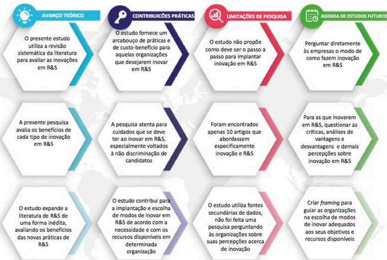
Figura 2: avanço teórico, contribuições práticas, limitações da pesquisa e agenda de estudos futuros:

A figura a seguir traz de forma sucinta o avanço teórico, as contribuições práticas, as limitações desta pesquisa e agenda de estudos futuros: