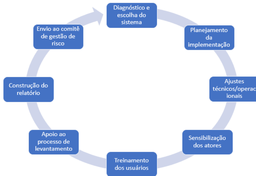
Figura 03 – Etapas do processo de implementação

As etapas metodológicas foram planejadas da seguinte maneira, conforme representadas na figura 03.