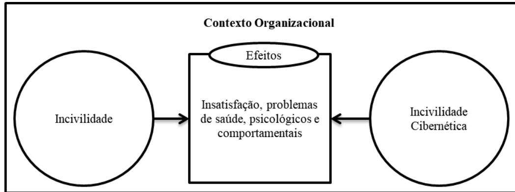
Figura 2 - Modelo conceitual dos efeitos da incivildade e a incivildade cibernética no contexto organizacional