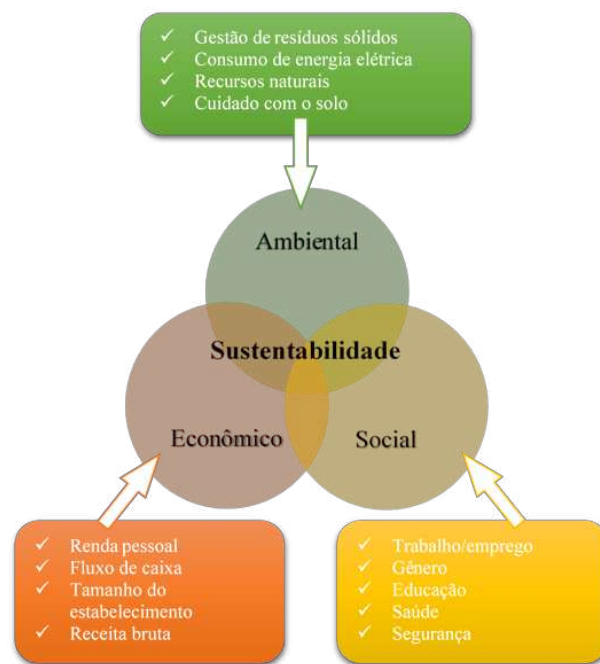
Figura 1 - O Tripé da sustentabilidade

Fonte: Adaptada de Slaper e Hall (2011) e Elkington (2012).