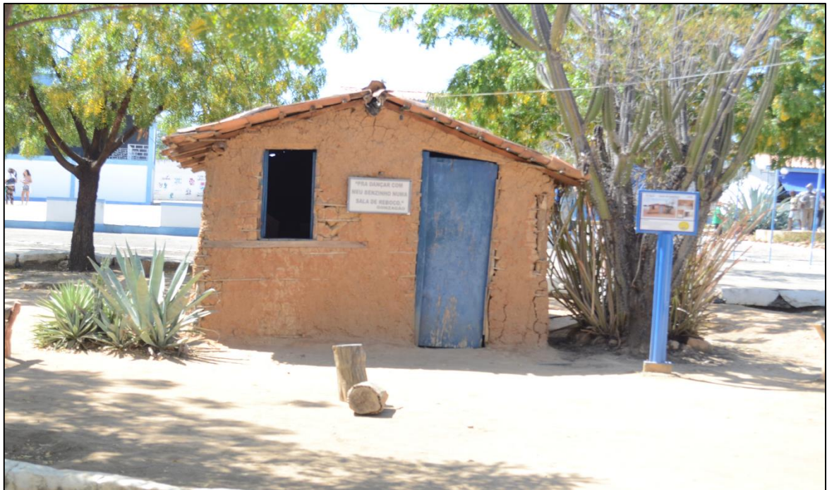
Figura 5: Fotografia da casa de taipa