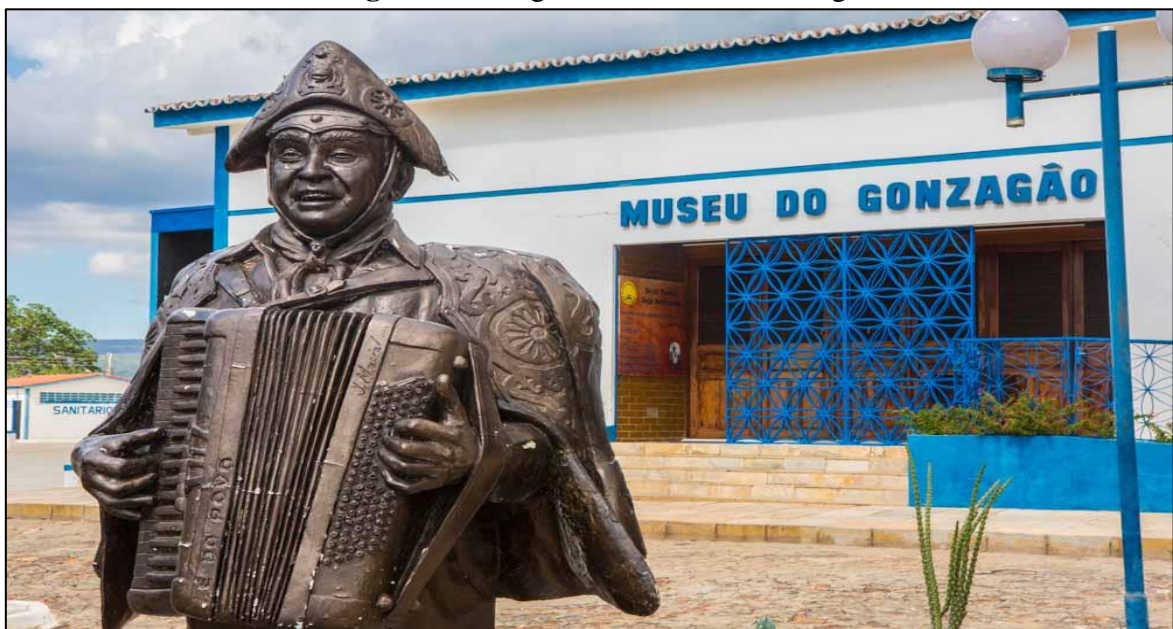
Figura 6: Fotografia Museu do Gonzagão