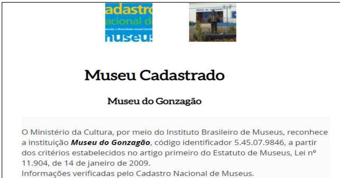
Figura 1: Cadastro do Museu do Gonzagão no Sistema Nacional de Museus