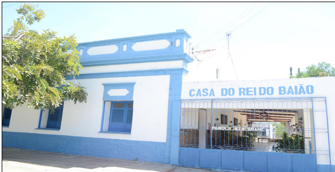
Figura 4: Fotografia da casa do Rei do Baião