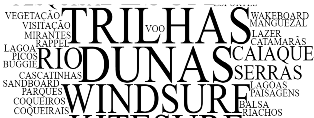
Figura 1 – Nuvem de palavras relacionadas às preferências desenvolvidas nas unidades de uso sustentável.

Em relação às atividades econômicas, no tocante às atividades de subsistência, há predominância da pesca e da agricultura. Já em relação às atividades econômicas de exploração, há destaque para as atividades turísticas. Por meio desta pesquisa, foi possível identificar as preferências da sociedade em relação a cada unidade de conservação. A Figura 1 complementa o Quadro 5 e apresenta uma nuvem de palavras referente às preferências de atividades desenvolvidas nas unidades de uso sustentável.