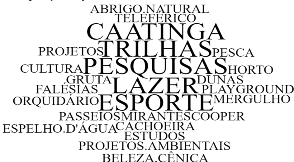
Figura 2 - Nuvem de palavras relacionadas às preferências de atividades desenvolvidas nas unidades de proteção integral

Por fim, as Estações Ecológicas, que se tratam de áreas de posse e domínio público que servem à preservação do ambiente e à realização de pesquisas científicas, foram identificada em três localidades do Estado do Ceará (Pecém, Aiuaba, e Jaguaribara). A Figura 2 subsidia a análise do Quadro 6 por meio da nuvem de palavras referente às preferências de atividades desenvolvidas nas Unidades de Proteção Integral.