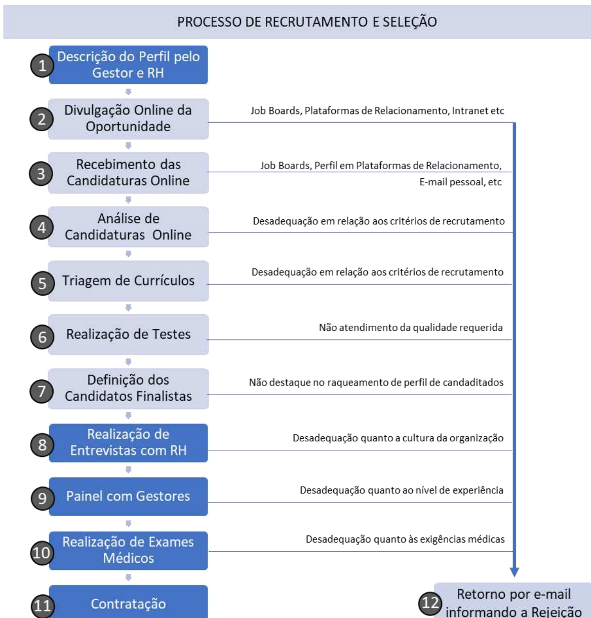
Figura 1 – Processo de recrutamento e seleção.