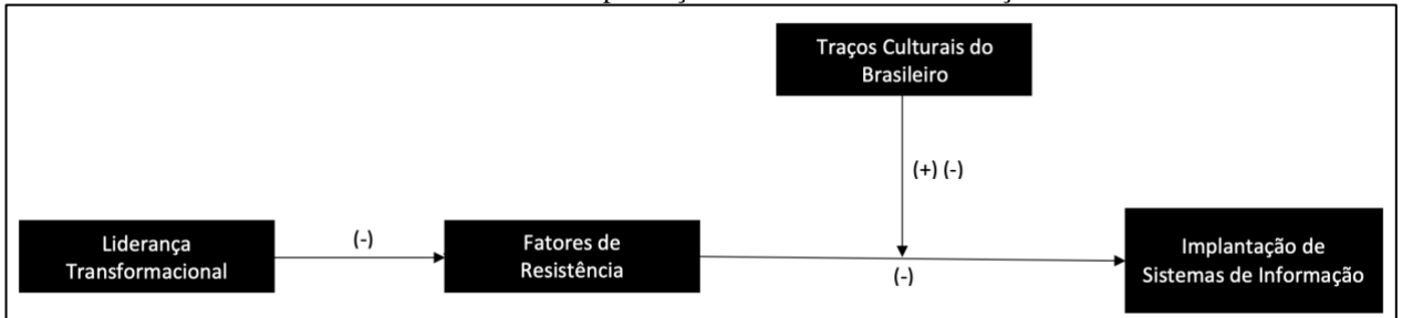
Figura 1 – Representação gráfica resumida do modelo teórico de influência dos traços culturais brasileiros nos fatores de resistência à implantação de Sistemas de Informação.