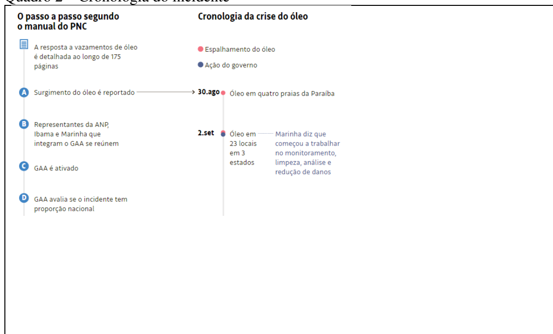
Quadro 2 – Cronologia do incidente

O Quadro 2 apresenta de forma resumida a cronologia do incidente em paralelo com as ações previstas no PNC (UOL, 2019.2).