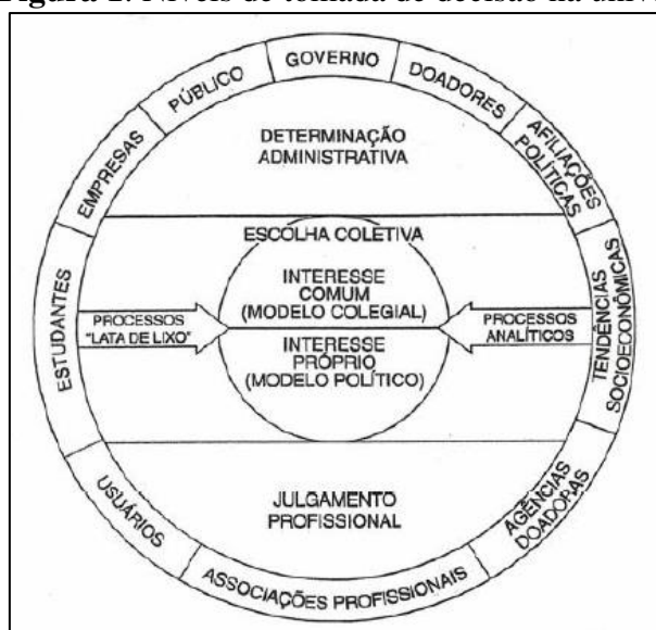
Figura 1: Níveis de tomada de decisão na universidade.

As universidades, pelas características peculiares que apresentam, se assemelham ao modelo de organização caracterizado por Mintzberg (2012) como burocracia profissional. Na burocracia profissional, muitas das suas decisões só podem ser realizadas por professores no âmbito individual. Outras decisões podem estar sob o controle de administradores. E muitas decisões importantes emergem de processos coletivos e interativos, entre professores e administradores. Hardy et al (1983) apresentam um modelo sobre como as decisões ocorrem nas universidades, por julgamento profissional (professores), determinação administrativa e pela coletividade na universidade, conforme a Figura 1.