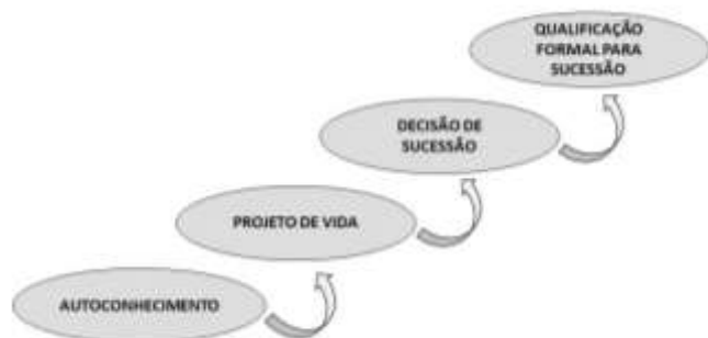
Figura 2 – Processo de sucessão familiar segundo resultados da pesquisa.