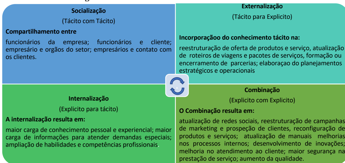
Figura 2 – Síntese da Conversão do conhecimento

Esse conhecimento explícito é transformado novamente em tácito - Internalização - por meio: (a) da ampliação do capital intelectual dos consultores de viagem; (b) de uma maior carga de conhecimento pessoal e experiencial sobre roteiros e pacotes; (c) de maior carga de informações para atender demandas dos clientes e ampliação de suas habilidades e competências profissionais.