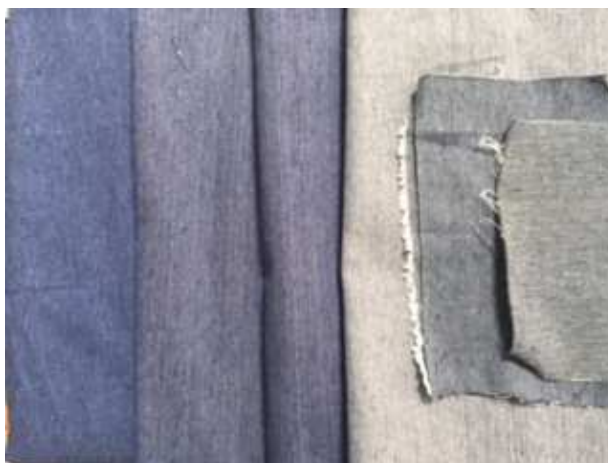
Figura 1 – Padrão de tonalidade do tecido reciclado composto por 55% Algodão; 44% Poliéster reciclado e 1% Elastano.

Após o tecido reciclado chegar a empresa esse percorre o caminho do processo linear, em termos de qualidade e tingimento, mesmo para os tecidos que já vem tintos, como demonstra a Figura 1.