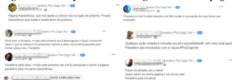
Figura 01 – Receptividades dos seguidores da Fanpage #PraCegoVer