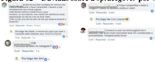
Figura 02 – Dúvidas sobre a #pracegover por videntes