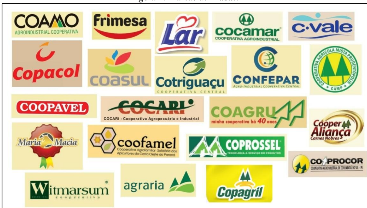
Figura 1. Marcas utilizadas.

As marcas utilizadas no estudo estão apresentadas na Figura 1.