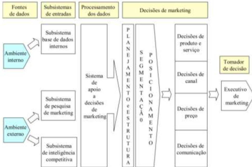
Figura 1 Modelo Chiusoli (2005) de Sistema de Informação de Marketing

marketing (Figura 1). Desde então não houveram significativas modificações em modelos de sistema de informação de marketing. Os artigos mais recentes investigam a aplicação dos sistema de informação de marketing em segmentos ou discutem a construção de inteligência em marketing (Crick & Crick, 2015; Fitriana, Kurniawan, Barlianto, & Adriansyah, 2016; Lin, Hsu, & Yeh, 2015; Novikova, 2015).